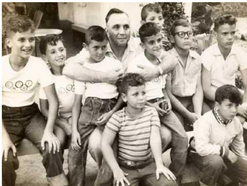
Meninos no Acampamento Nosso Recanto – NR – década de 50