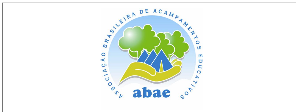
Logotipo da Associação Brasileira de Acampamentos Educativos – ABAE – 2002

O objetivo maior da criação da Associação foi iniciar a organização de um segmento que não tem apoio de órgãos competentes como a EMBRATUR, MEC ou Secretarias de Turismo, contribuindo assim para o aprimoramento de aspectos básicos na atividade como: saúde, segurança, infra-estrutura e recursos humanos.