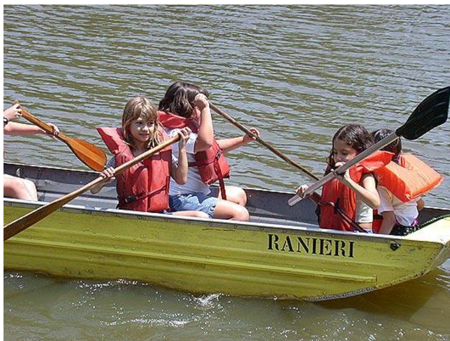
Passeio de barco no Acampamento Rancho Ranieri, São Lourenço da Serra – 2002

encontro aos interesses e necessidades das escolas em suas saídas, para que estas sejam seguras e realmente surtam o efeito desejado.