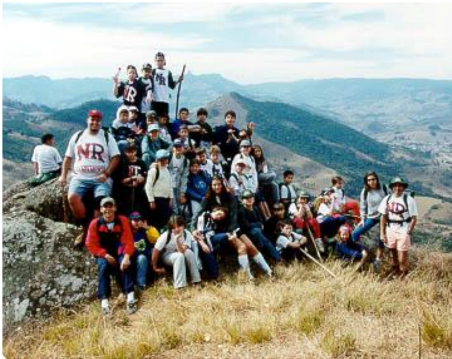
Estudo do meio no Acampamento Nosso Recanto, Sapucaí Mirim – 2002

parece ser infinita e sempre surgem novas formas de se aproveitar a mesma estrutura.