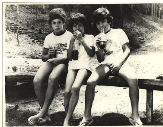
Meninos no Acampamento Paiol Grande – década de 70

suas atividades em meados de 1949, até que em setembro do mesmo ano, trazido dos EUA, Pe. Edmundo Nelson Leising aceitou a difícil missão de reerguer um acampamento desconhecido porém pioneiro no Brasil.