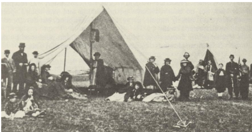
Acampamento Gunnery, Connecticut, EUA – 1862.