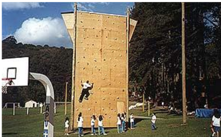
Parede de Escalada no Acampamento Turma do Leões – 2002

anos, como locais ideais para a realização de viagens de formaturas para alunos de ensino médio e ensino fundamental. Atendendo as expectativas de pais, alunos e professores, as formaturas em acampamentos movimentam grande parte do segundo semestre, com eventos para 8as séries e 3os colegiais.