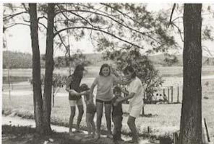
Crianças e Jovens brincando no Acampamento Billings - ACM.