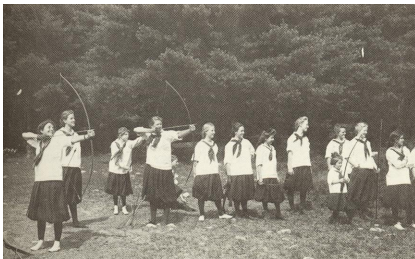
Acampamento feminino, EUA – 1913