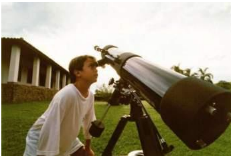
Observação dos astros no Sítio do Carroção, Tatuí – 2002

língua estrangeira torne-se divertido e agradável. Nos últimos anos eventos para colégios e escolas de línguas têm sido muito procurados para estimular a prática de outras línguas de forma espontânea.