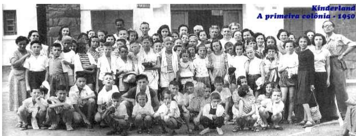
Primeira Colônia de Férias Kinderland – 1950

de férias. A primeira colônia de férias foi realizada em 1950, num hotel em Lindóia e da qual participaram 65 crianças. No ano seguinte, a segunda edição da colônia contou com a presença de 150 crianças num hotel em Guararema. O grande sucesso dessas experiências pioneiras evidenciou a necessidade de se obter um local próprio para viabilizar novas temporadas de férias nos anos seguintes. Assim, em 29 de outubro de 1951 foi comprado a Kinderland em Sacra Família do Tinguá, que no verão de 1952 recebeu o primeiro grupo de jovens, apesar das pequenas e precárias acomodações existentes no local.